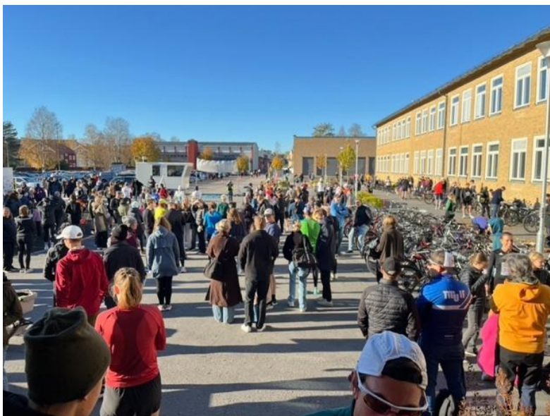
Publikt på Umemaran